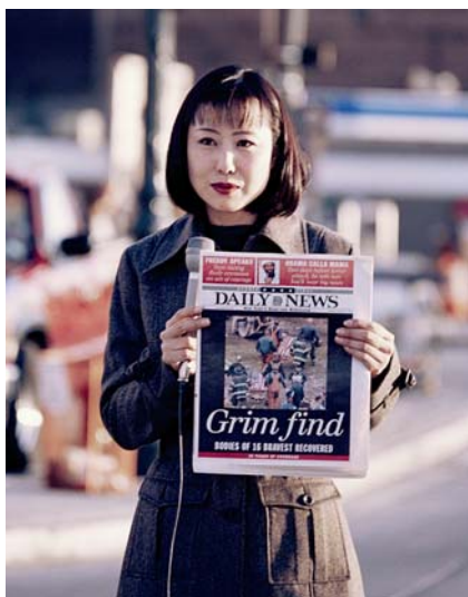
2 octobre, 2001 (#2)