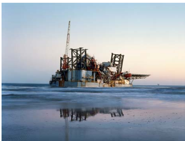
Plate-forme pétrolière "Ocean Warwick", Dauphin Island, Alabama, 2005