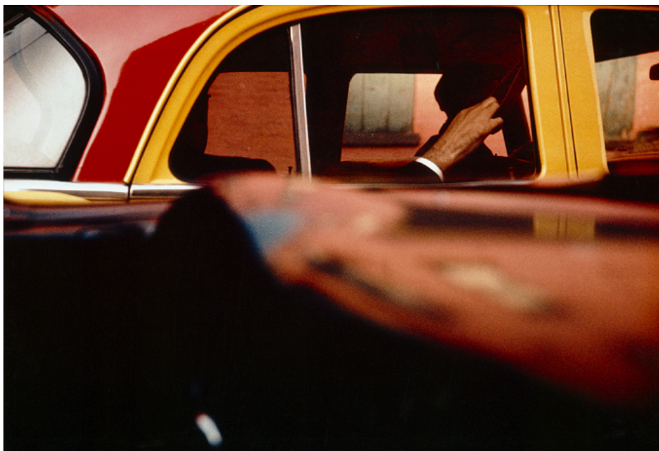
Saul Leiter, Taxi, 1957

Commissaire : Sam Stourdzé, Musée de l'Élysée