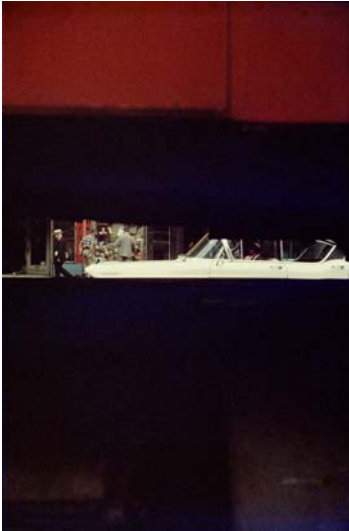
Through Boards, 1957