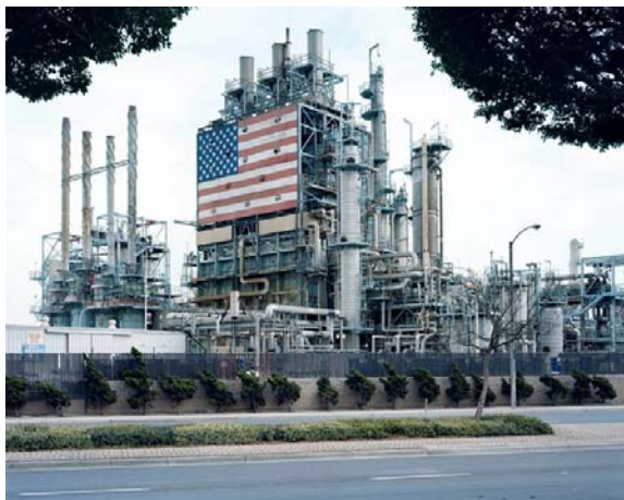
Raffinerie BP à Carson, Californie, 2007