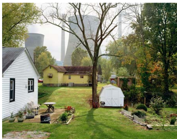
Centrale thermique d'Amos, Raymond City, Virginie Occidentale, 2004