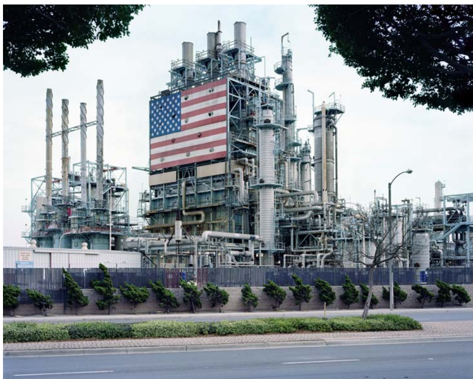
Mitch Epstein, Raffinerie BP à Carson, Californie, 2007 © Black River Productions, Ltd./Mitch Epstein. Courtesy Thomas Zander, Cologne