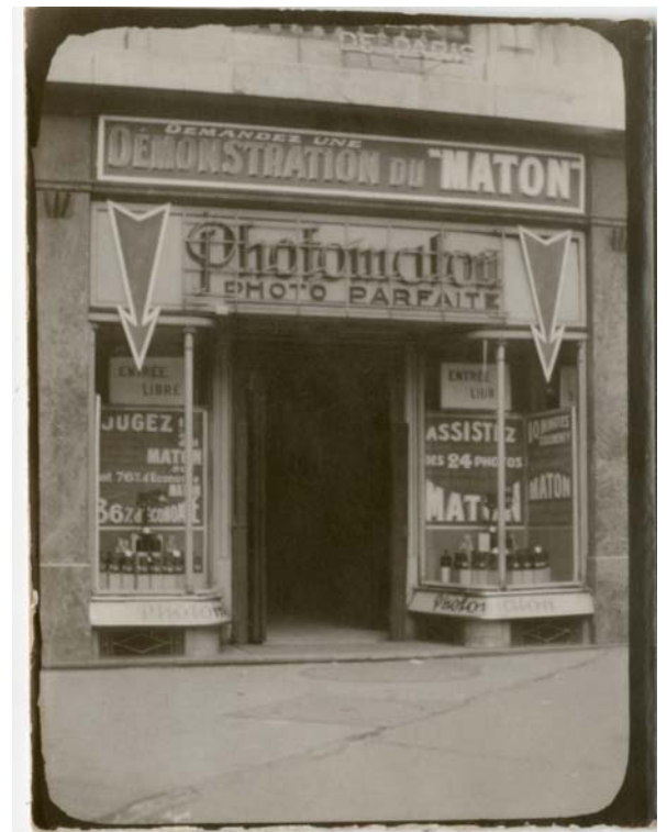
Anonyme, Boutique de Photomaton, épreuve argentique, vers 1930. Courtesy Collection Emmanuelle Fructus, Paris

L'exposition comprend plus de 300 pièces et réunit différents médium – huiles sur toile, lithographies, montages et projections – révélant l'étendue de l'influence du Photomaton sur le milieu artistique