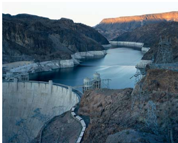
Barrage de Hoover et Lac Mead, Nevada/ Arizona, 2007