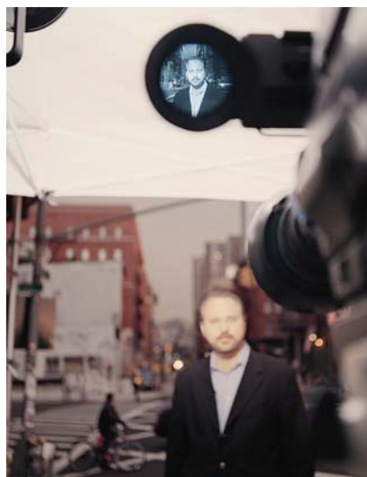
2 octobre, 2001 (#1)