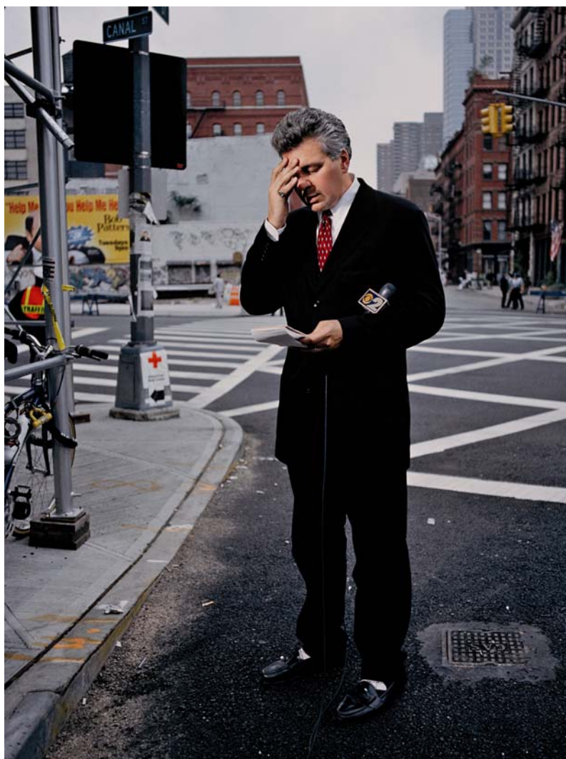
Frank Schramm, 28 septembre, 2001 (#4)

L'Autre Amérique propose trois regards, trois portraits différents d'un pays au passé nostalgique ou confronté aux difficultés actuelles. Ces trois expositions nous incitent à nous interroger sur les contrastes entre le rêve américain et une grande puissance en proie aux défis énergétiques ou à la menace terroriste.