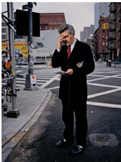
28 septembre, 2001 (#4)