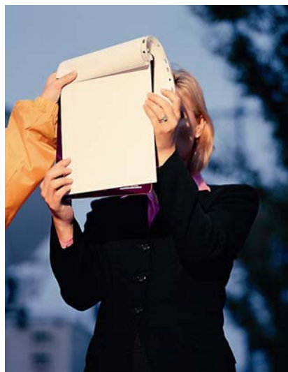
17 septembre, 2001 (#5)