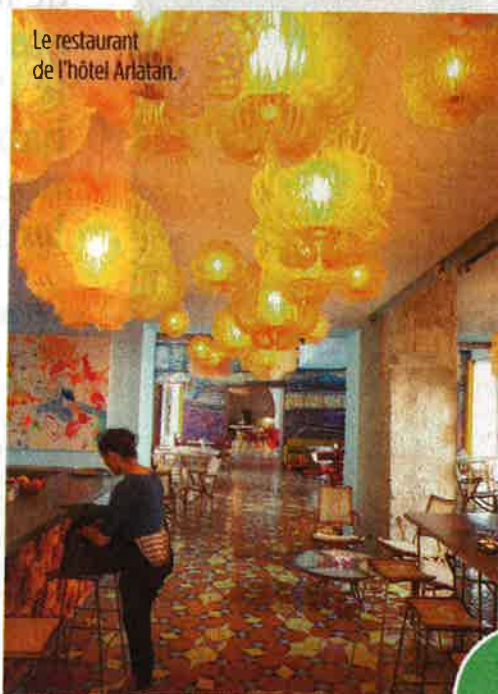
Le restaurant de l'hôtel Ariatan.