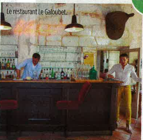
Le restaurant Le Galoubet.