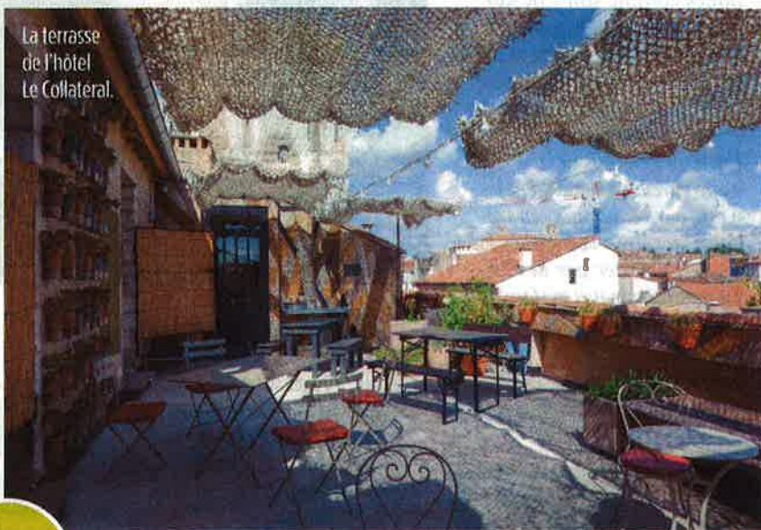
La terrasse de l'hôtel Le Collatéral.