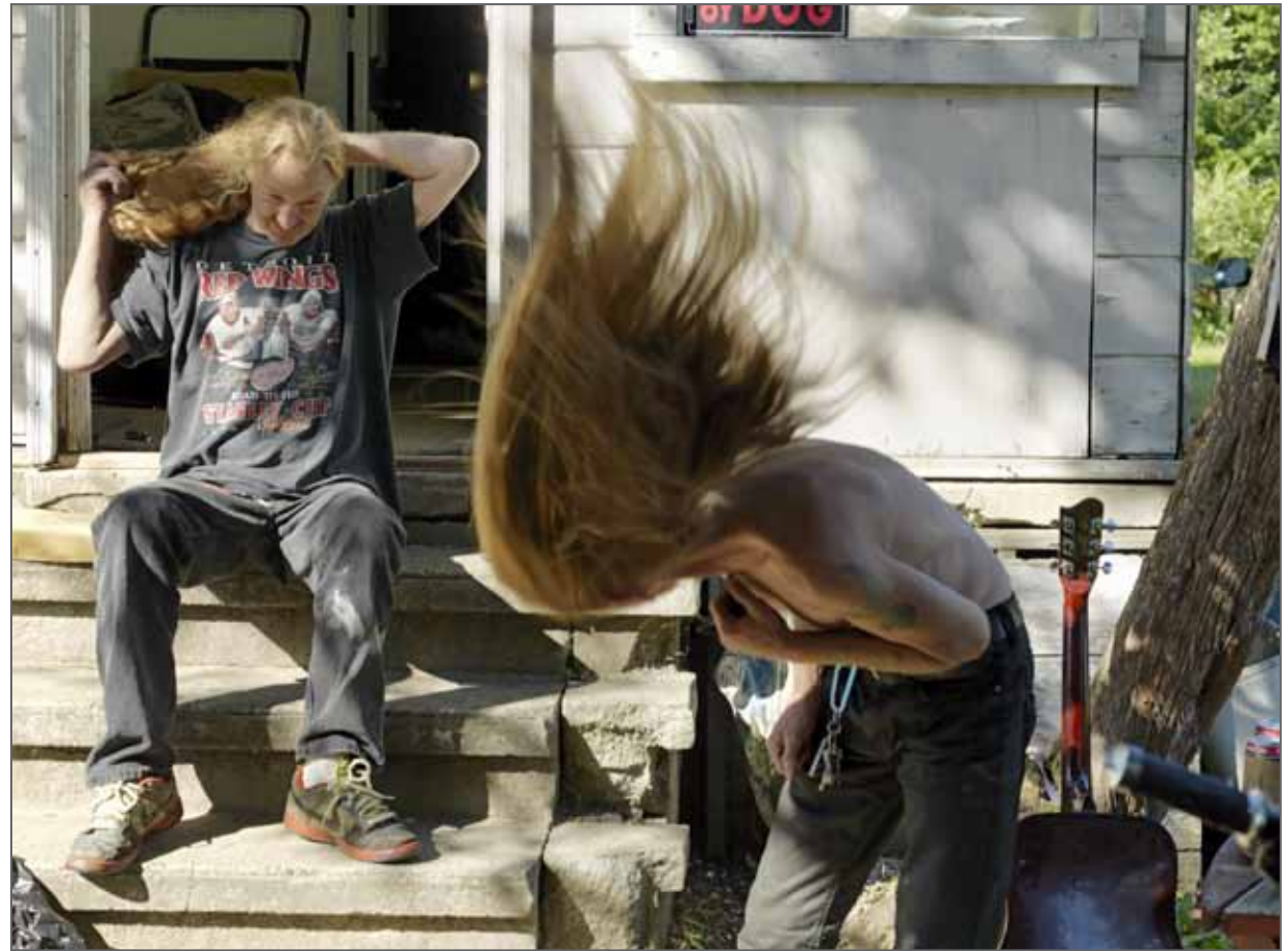
USA, Datazone Flint 19 Série Drive Thru 2015