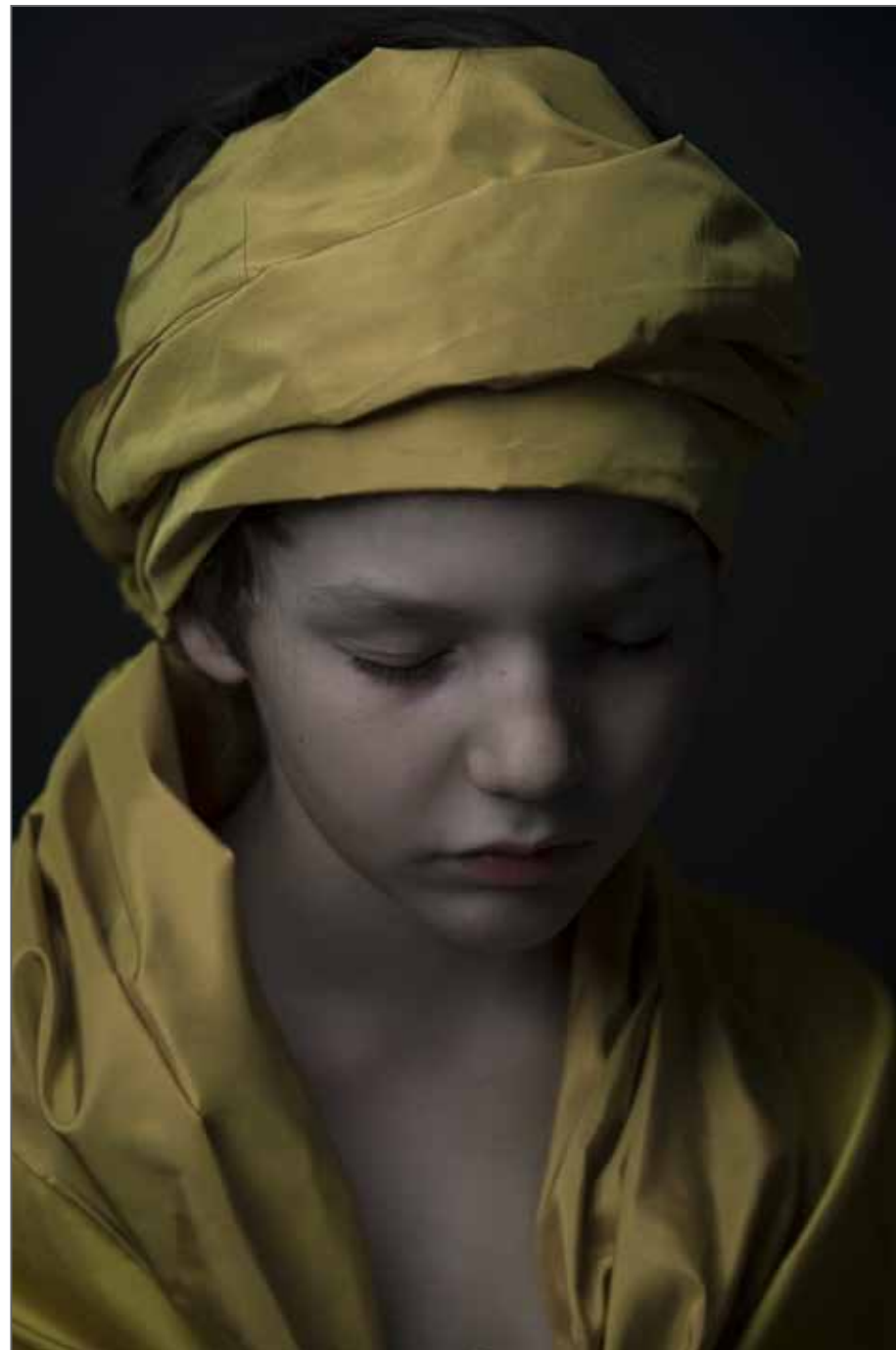
"Precious Silence", 2015 © Danielle Van Zadelhoff