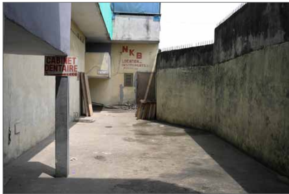
Sans titre, Adjamé, Abidjan 2017