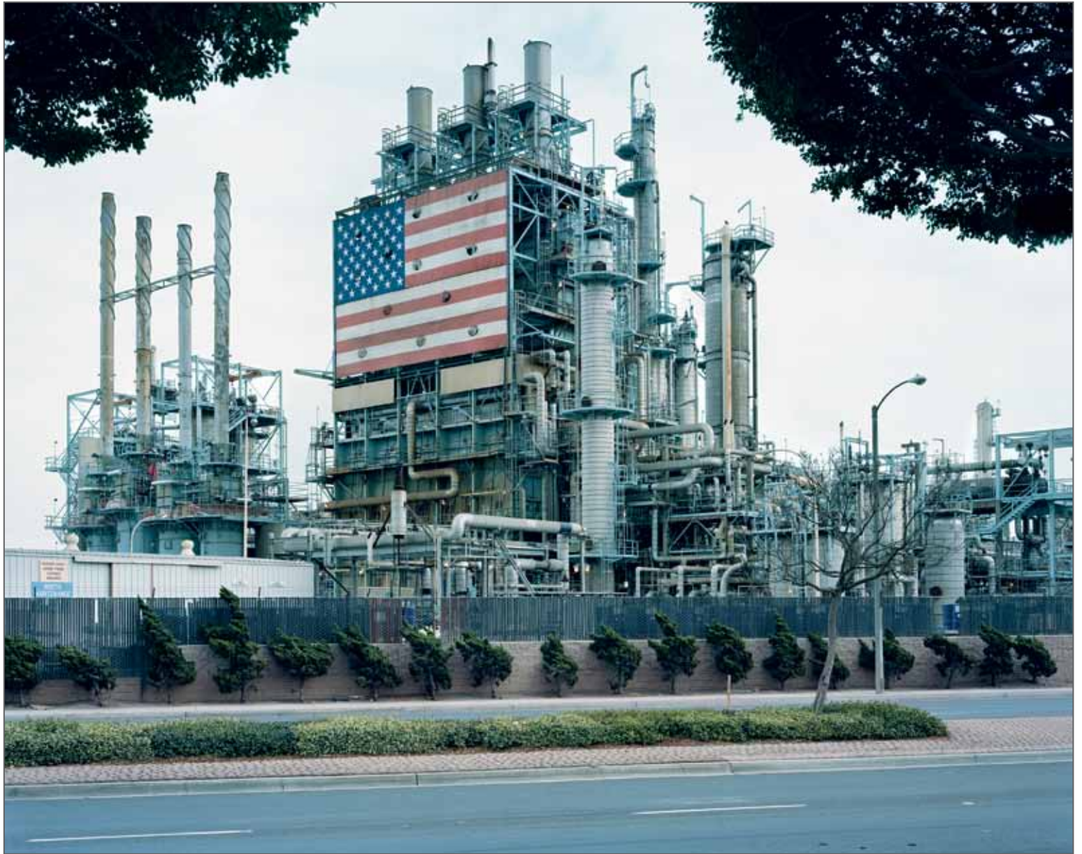
"BP Carson Refinery", California 2007