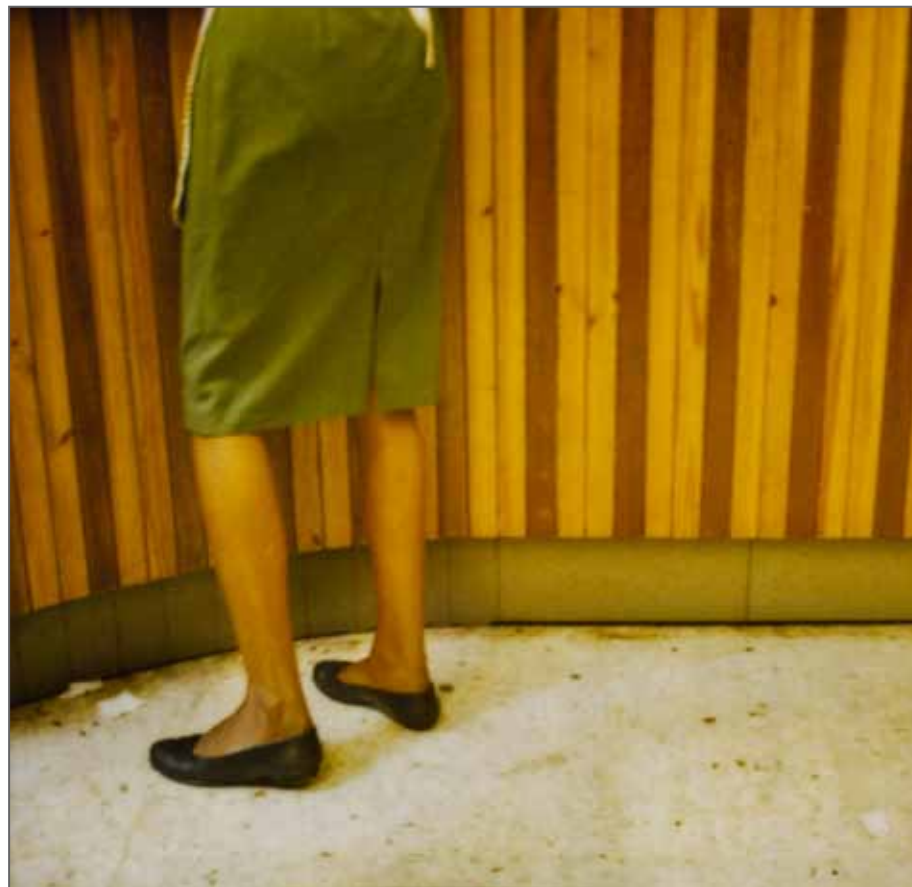
"Asmara Dream #35"

On n'a jamais projeté de faire des expositions, ni des livres, mais actuellement, quand on a une collection avec autant de pièces - et je reviens vers vos premières questions - c'est vraiment par le biais des expositions et des publications en montrant et en partageant que nous pouvons prolonger notre plaisir.