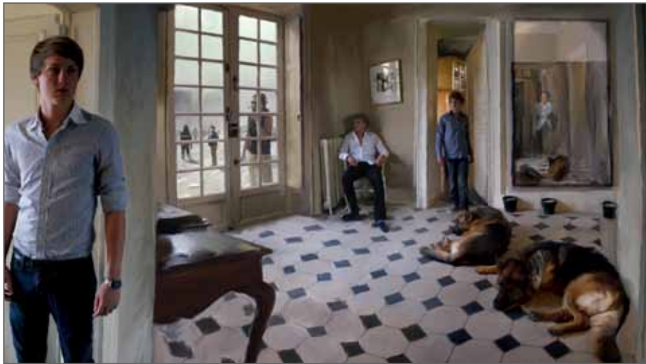
"Le bruit du monde", 2010 © Bachelot-Caron